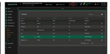
Gestor de dispositivos