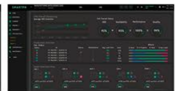
Cuadro de mando