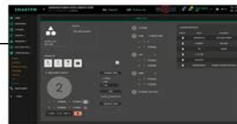
Planificador de flujos de trabajo